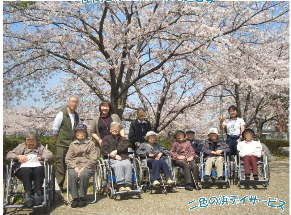
二色の浜デイサービス